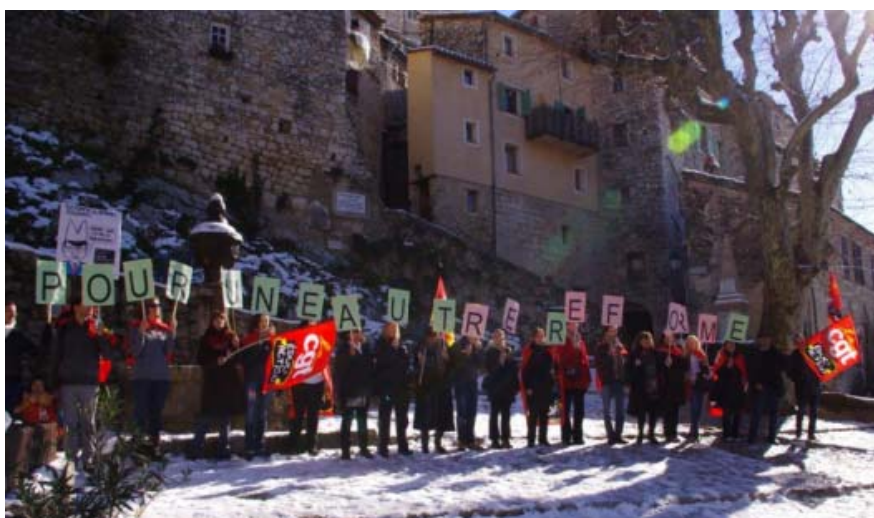
Manifestation de la Cgt Éduc'action à... Peillon (06)

L'objectif affiché était de défricher le terrain des idées et d'avancer des pistes de réforme afin de préparer la future loi d'orientation. Soucieuse de travailler à cette Refondation , la CGT Éduc'action a pris ses responsabilités et a participé activement aux différents ateliers. Nous n'étions pas dupes sur la portée de ce genre d'événement, mais nous ne pouvions être absents. C'était pour nous le moment de porter nos revendications et de faire entendre publiquement notre voix, en dehors des tractations de certains autres syndicats dans les couloirs du Ministère.