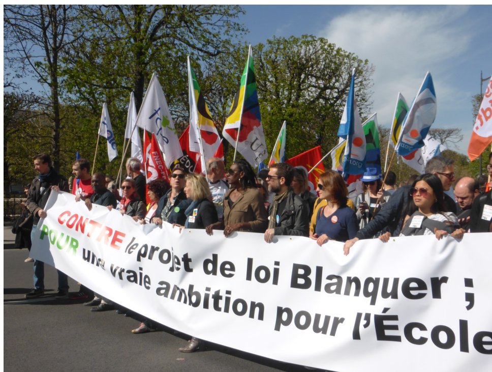
Manifestation unitaire contre le projet de loi Blanquer, à Paris le 30 mars 2019